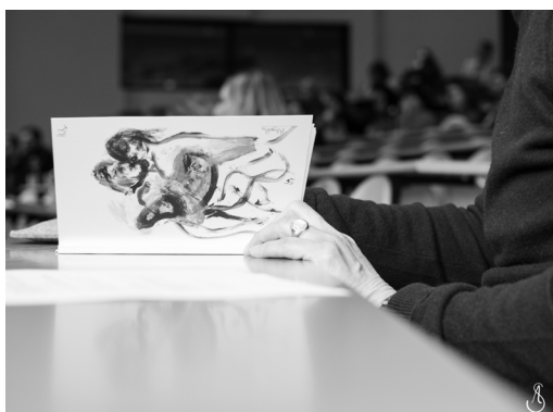
27 mars 2026

Les intervenants, universitaires et représentants du monde tutélaire, ont présenté les spécificités de la prise de décision et de ses conséquences lorsqu'il s'agit de décisions prises par des personnes protégées qui sont soit représentées soit assistées précisément parce que, juridiquement, ces personnes sont considérées comme incapables à exprimer une volonté efficace.